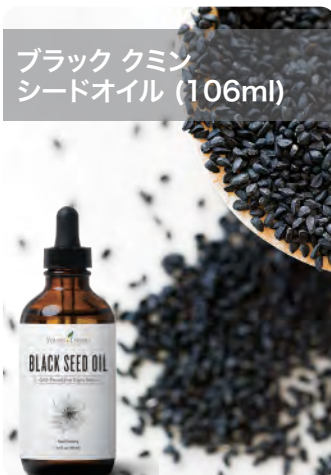
ブラック クミン シードオイル (106ml)