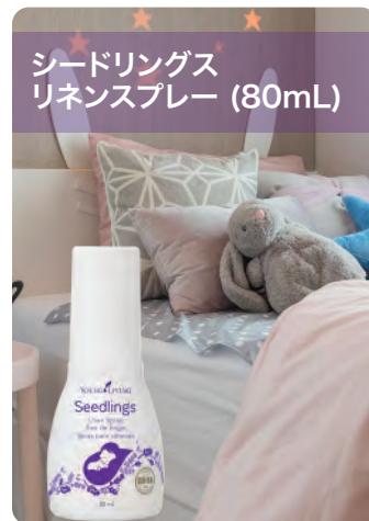
シードリングス リネンスプレー (80mL)