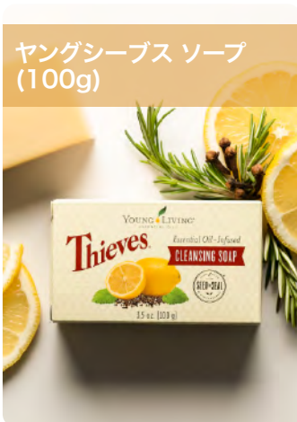
ヤングシーブス ソープ (100g)