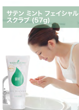
サテン ミント フェイシャル スクラブ (57g)