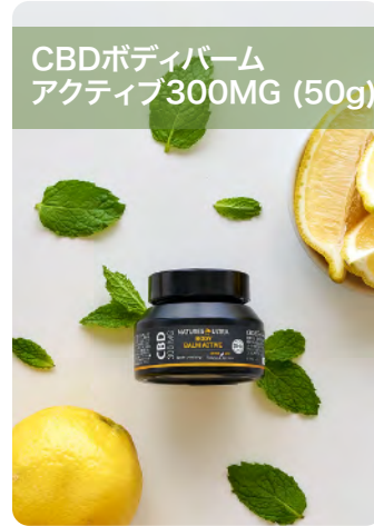
CBDボディバーム アクティブ300MG (50g)