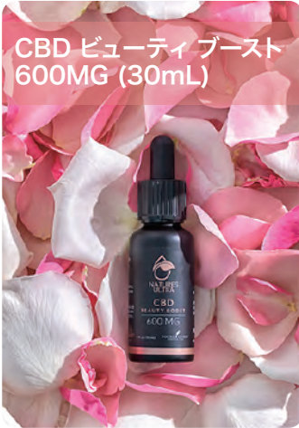
CBD ビューティブースト 600MG (30mL)