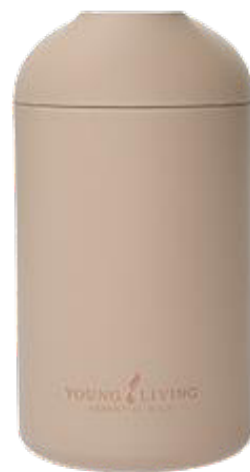
Difusor Wanderful de Young Living*