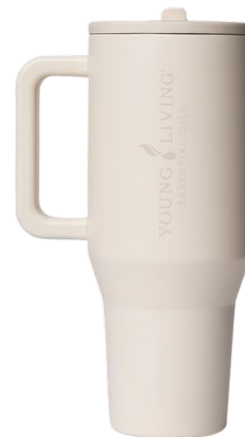
Botella para agua HydroJug*