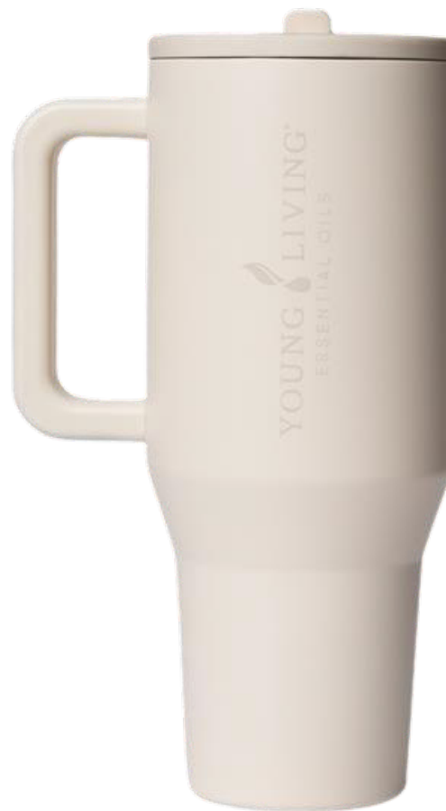
Botella para agua HydroJug*