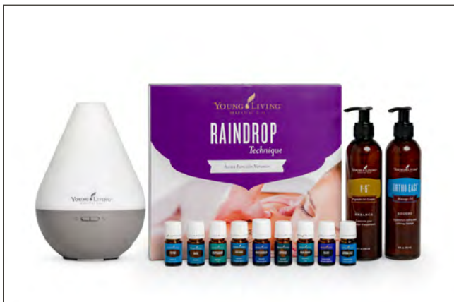
RAINDROP PSK CON DIFUSOR DEWDROP PRECIO: ₡101.120 | PV: 100