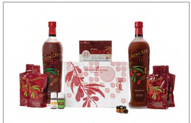
KIT DE INICIO PREMIUM NINGXIA RED PRECIO: ₡92,200 | PV: 100