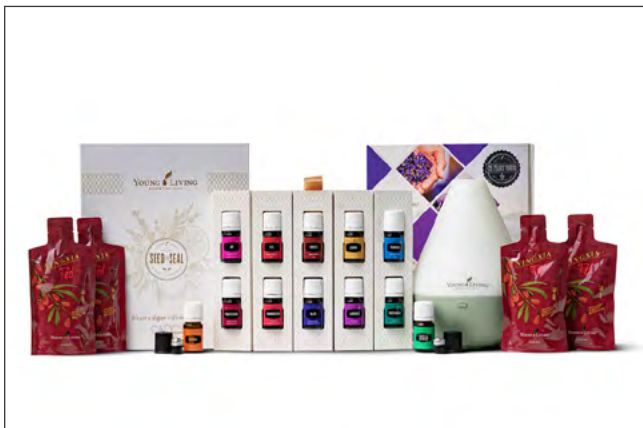
KIT DE INICIO PREMIUM CON DIFUSOR DEWDROP PRECIO: ₡98,140 | PV: 100