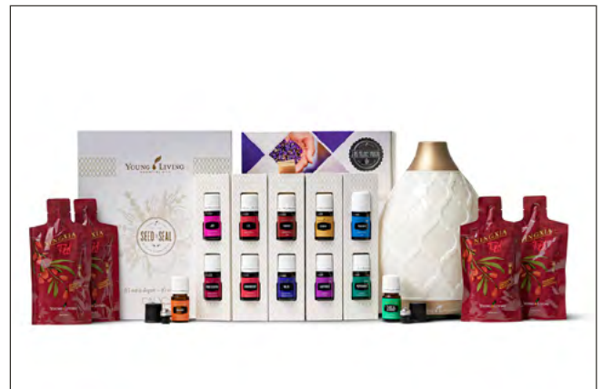
KIT DE INICIO PREMIUM CON DIFUSOR DESERT MIST PRECIO: ₡98,140 | PV: 100