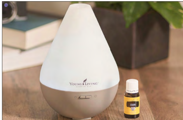
KIT DE INICIO BÁSICO RESPIRA BIENESTAR PRECIO: ₡39.990 | PV: 44.25