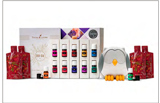
KIT DE INICIO PREMIUM CON DIFUSOR BÚHO PRECIO: ₡92,200 | PV: 100