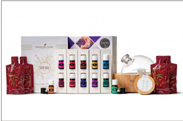
KIT DE INICIO PREMIUM CON DIFUSOR ARIA PRECIO: ₡154,650 | PV: 100