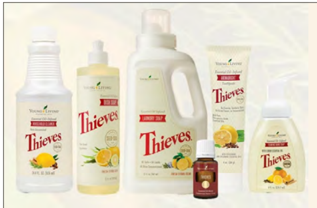
KIT DE INICIO PREMIUM THIEVES PRECIO: ₡71.100 | PV: 100