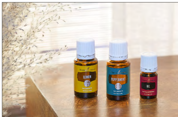
KIT DE INICIO BÁSICO INHALA FRESCURA PRECIO: ₡27.910 | PV: 44