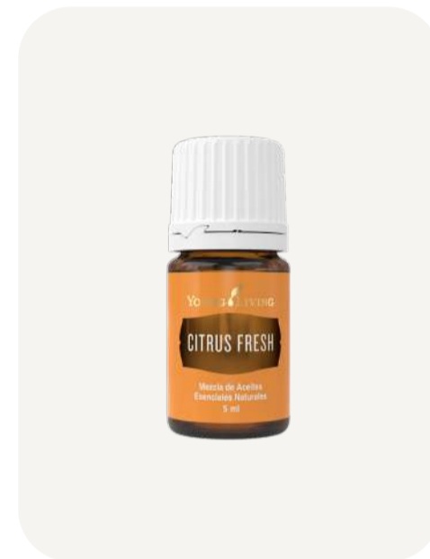
Muestras de Aceite Esencial Citrus Fresh