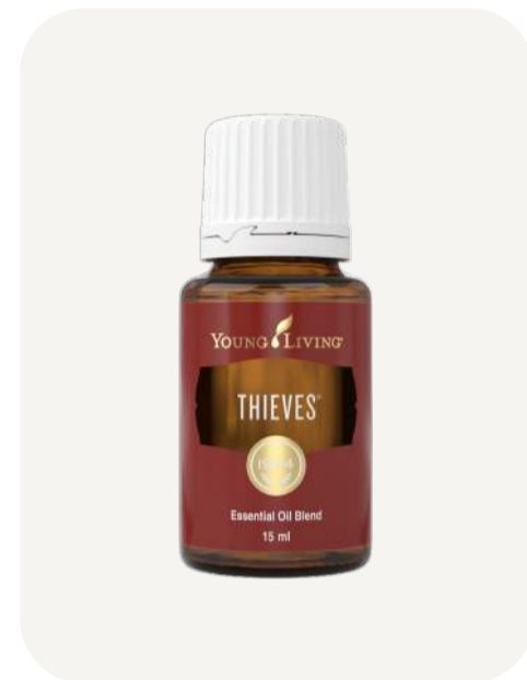
Aceite Esencial Thieves 15 ml