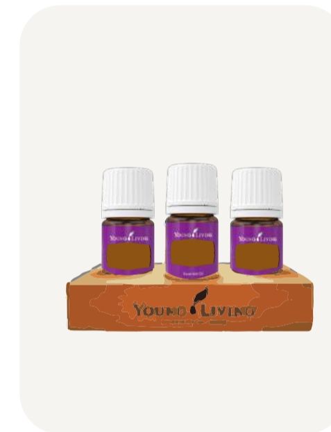
Base de madera con capacidad de 3 aceites (no incluye aceites)